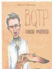
BQTP. Tanque parèntesi MARTÍ R. ELECTRIQUE LaBreu Edicions

M artí Rasoir Electrique (València, 1979) dona a conèixer el seu segon volum de cròniques autobiogràfiques –que neixen al blog Busque qui t'ha pegat –: Tanque parèntesi retrata el seu dia a dia laboral, anímic i sentimental, compaginant consideracions sobre el País Valencià d'ara amb les últimes aventures i relacions homosexuals. El to és divertit i estripat: “¿Follaries amb un tio que porta un queixal de cocodril penjat al coll?”