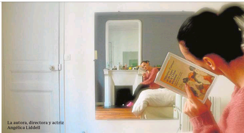
La autora, directora y actriz Angélica Liddell