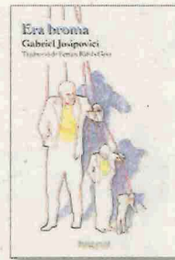
ERABROMA GABRIEL JOSIPOVICI RAIG VERD TRAD. FERRAN RÀFOLS 176 PÀG./16 €

L'Héctor Amat viu encadenat a l'ansietat. Després de presenciar l'assassinat d'una noia, aquesta patologia se li accentuarà i es veurà obligat a visitar una terapeuta misteriosa perquè el seu dia a dia torni a la normalitat. D'aquesta relació professional, Hernández en fa néixer una història d'amor i dependència i, en paral·lel, traça una mirada crítica sobre l'estrès que governa la nostra societat.