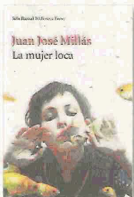
LA MUJER LOCA JUAN JOSÉ MILLÁS SEIXBARRAL 240 PÀG./17,50 €

Els escrúpols no aturen Frank Friedmaier, que està obsessionat a matar un desconegut per assolir la plenitud. Un dels seus amics el convencerà per assassinar un oficial alemany, però el crim tindrà testimonis que precipitaran els esdeveniments. El cinisme i la vilesa trenquen les fronteres de l'ètica i construeixen paradoxes sobre la maldat, la innocència i les motivacions del protagonista.