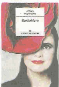
BARBABLAVA AMÉLIE NOTHOMB ANAGRAMA TRAD. FERRAN RÀFOLS 144 PÀG./14,90 €

Res és el que sembla a Era broma , una història carregada de mentides que distreuen la veritat. Un baró contracta un detectiu perquè sospita que la dona li és infidel, però resulta que, abans, ella ja havia demanat a l'investigador privat que assassinés una amant del seu marit. L'argument s'embolica en una farsa addictiva que demostra com la realitat amaga una pila de manipulacions.