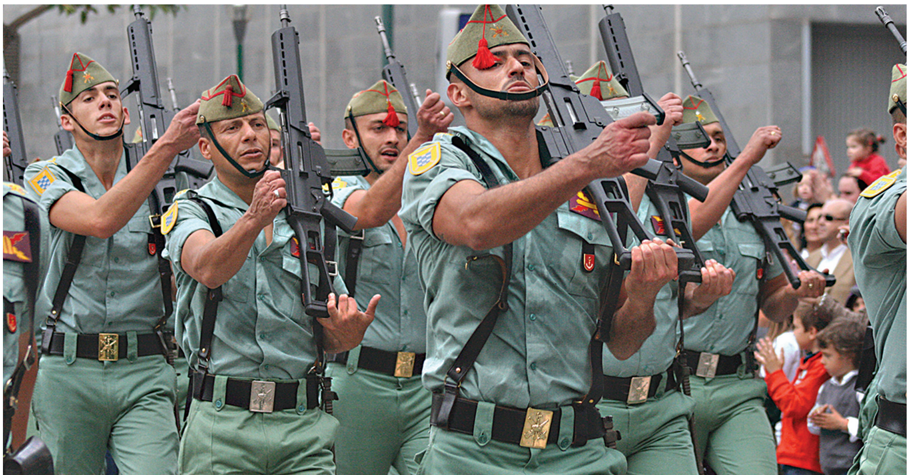
Els soldats rasos són la 'xusma', en l'argot militar, mentre que els oficials són els 'blancs' i els sotsoficials, els 'negres'