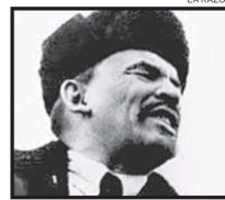
¿Podía haber vuelto Lenin a la vida?

El libro se divide a partes iguales entre el análisis del surgimiento de la pseudociencia parapsicológica en Inglaterra y el intento de divinizar al ser humano de los «constructores de Dios» soviéticos. La primera parte comienza con una sesión de espiritismo en 1874 a la que asistieron Charles Darwin y George Eliot, para luego tratar por extenso el nacimiento de la Sociedad para la Investiga-