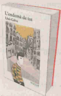
L'ENDEMÀ DE TOT Lluís Calvo

En Soterés és un fotògraf professional que no compra el diari que publica les seves fotogra-