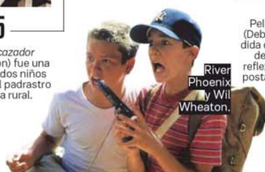
River Phoenix y Wil Wheaton.

«Wild» (Jean-Marc Vallée) es un viaje interior y exterior que habla de la búsqueda de las raíces por una América fantasmal», dice Salgado. Aquí se verá en 2015.