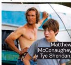
Matthew McConaughey y Tye Sheridan.

Jeff Nichols, quien consagró a Matthew McConaughey como actor serio con Mud , estudió con David Gordon Green. Sus trabajos muestran similitudes.