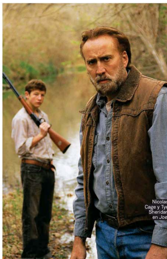
Nicolas Cage y Tye Sheridan en Joe.