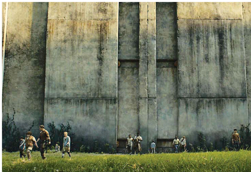
Un gigantesco laberinto ante el que solo cabe correr.

Los adolescentes más distópicos están de enhorabuena: mientras esperan el cierre de la trilogía de "Los Juegos del Hambre", pueden llevarse a los ojos el inicio de la de "El corredor del laberinto" (Nocturna), de James Dashner. MILO J. KRMPOTIC'