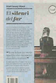
ELSILENCI DELFAR ALBERT JUVANY EDICIONS DEL PERISCOPI 236 PÀG./18,50 €

El poble de pescadors islandès de Húsavík reunia les característiques que buscava, perquè és un lloc petit, castigat per un clima difícil, cosa que contribueix a la introspecció i al punt feréstec de la majoria dels seus habitants. L'Anna hi fa de bibliotecària, i a l'inici de la novel·la rep una carta del seu pare en què li demana perdó, molts anys després, per haver