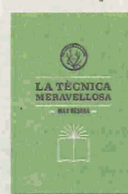
LA TÈCNICA MERAVELLOSA MAX BESORA MALES HERBES 222 PÀG./14 €

"La lluita de fons de la novel·la es dona entre dues maneres d'accedir al coneixement: l'acadèmica i la sectària –admet Besora-. Les dues opcions t'ensenyen una veritat, la seva". La crítica al sistema universitari es fa present en frases com "l'estudiant avui és una mercaderia,