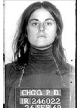
ENTRE LOS DELINCUENTES MÁS BUSCADOS. Dohrn y Ayers, ayer en Oviedo. Sobre estas líneas, sus fichas policiales en 1969.