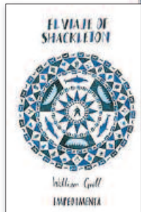
WILLIAM GRILL El viaje de Shackleton ► Traducción de Pilar Adón IMPEDIMENTA. 19,95 €

CONTACTO: opinionlibros@epi.es @opinionlibros