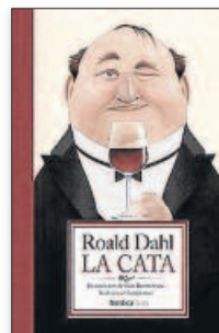
ROALD DAHL La cata ► Ilustrado por Iban Barrenetxea NÓRDICA. 19,50 €