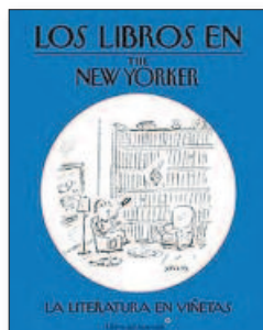
VV.AA. Los libros en The New Yorker ► Traducción de Miguel Aguayo LIBROS DEL ASTEROIDE. 15,95 €