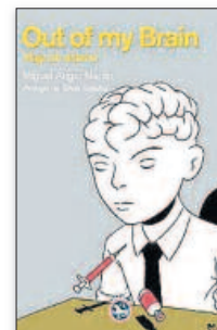
MIGUEL ÁNGEL MARTÍN Out of my brain. Viajes sin retorno ► Prólogo de Silvia Grijalba REY LEAR. 18,95 €