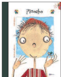
CARLO COLLODI Pinocho ► Concha López Narváez y Violeta Monreal (IL.) BRUÑO. 16,90 €