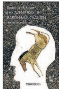
RUDOLF ERICH RASPE Las aventuras del barón Münchhausen ► Ilustrado por Javier Zabala NÓRDICA. 25 €