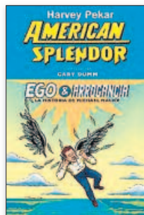
HARVEY PEKAR American Splendor. Ego & arrogancia ► Ilustrado por Gary Dumm GALLO NERO. 19 €