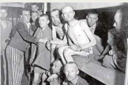
Prisioneros judíos en Treblinka

► Lo peor: Quizá Amar, ¿para qué? (Planeta) no sea el peor libro de 2014 pero sí el peor que me he tenido que leer. Y no porque esté mal escrito (que no lo está) sino por su sentido. Es decir, este libro, ¿para qué? Es el séptimo de María Teresa Campos. Escribe, entre otras cosas, que el amor está sobrevalorado. En su caso, verdades como muñones.