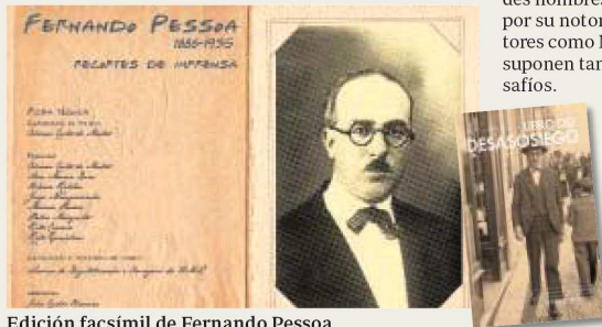
Edición facsímil de Fernando Pessoa

► Lo peor: Octavio Paz. Las palabras en libertad , de Guadalupe Nettel (Taurus / El Colegio de México). Un libro que contiene numerosos errores biográficos y muchos más de orden conceptual. Los grandes nombres atraen a algunos por su notoriedad, pero escritores como Nettel olvidan que suponen también grandes desafíos.