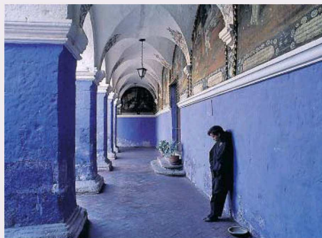
Claustro del convento de Santa Catalina, en Arequipa.