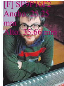
[F] SF9P16F2 Ancho: 23.25 mm Alto: 35.66 mm