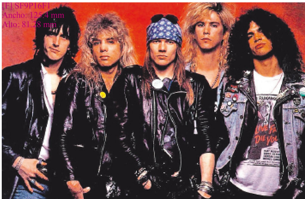
[F] SF9P16F1 Ancho: 125.4 mm Alto: 81.28 mm