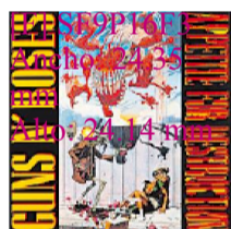
«APETITE FOR DESTRUCTION» Hard rock • Geffen Records • 1987 • 12 temas • 54 minutos