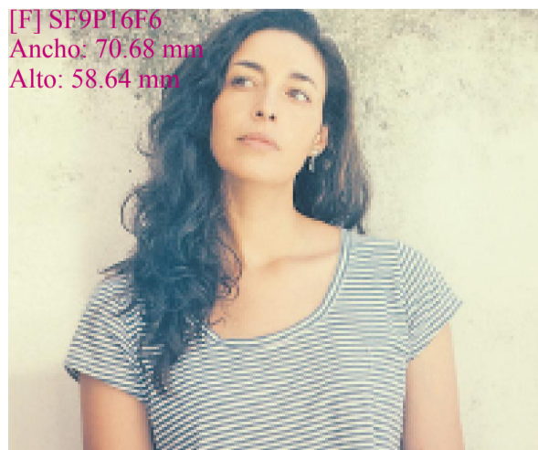
[F] SF9P16F6 Ancho: 70.68 mm Alto: 58.64 mm

Tal vez para escribir de Buenos Aires (o de cualquier otra cosa) haya que aproximarse justo así, desde lejos, con un largo rodeo. Claro que, como apunta Trías, «no hay que buscar la literatura; mucho menos la frase. A lo sumo se busca lo que está detrás de las palabras».