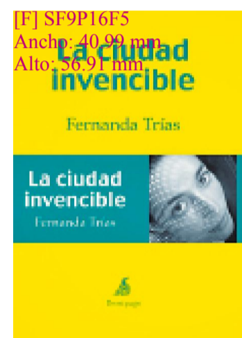
[F] SF9P16F5 Ancho: 40.99 mm Alto: 56.91 mm

En la antología Disculpe que no me levante Trías se apareció al lector, como una iluminación, con Cuerpos extraños . Un relato despiadado, de hermosa crudeza, como América misma. Y lo que aquel cuento implacable ya anticipaba se despliega en La ciudad invencible (Demipage), una breve novela donde la autora retrata con destreza y hondura su Buenos Aires, esa ciudad invencible e inabarcable que hizo decir nada menos que a Borges (cita que planta en el umbral del libro): «Esta ciudad que yo creí mi pasado es mi porvenir, mi presente; los años que he vivido en Europa son ilusorios, yo estaba siempre (y estaré) en Buenos Aires».