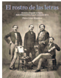
El rostro de las letras. Escritores y fotógrafos en España desde el Romanticismo hasta la Generación de 1914.

La presencia asturiana nun trai sorpreses: Clarín , Campoamor , Pidal y Mon , Vital Aza , Palacio Valdés , Pérez de Ayala , Vázquez de Mella , Suárez Bravo ... Nun llibru como esti, fechu col bon gustu d'incluyir retratos de los autores más representativos de les lliteratures catalana y gallega (nun ta la vasca) échase en falta una mínima amuesa iconográfica de la lliteratura n'asturianu: por exemplu, les semeyes conocíes de Fernán-Coronas nun desameriten en calidá de les que vienen de los sos contemporáneos, entanto que la so figura histórica, el so valir lliterariu y la trascendencia llingüística del de Cadavéu pue midise perfectamente con Verdaguer , Guimerá , Pondal o Otero Pedrayo ensin malparanza nenguna.