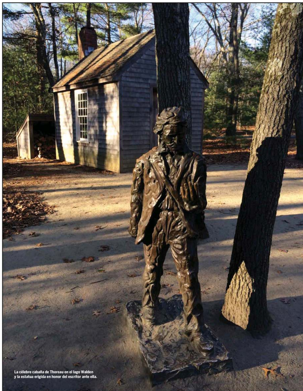
La célebre cabaña de Thoreau en el lago Walden y la estatua erigida en honor del escritor ante ella.