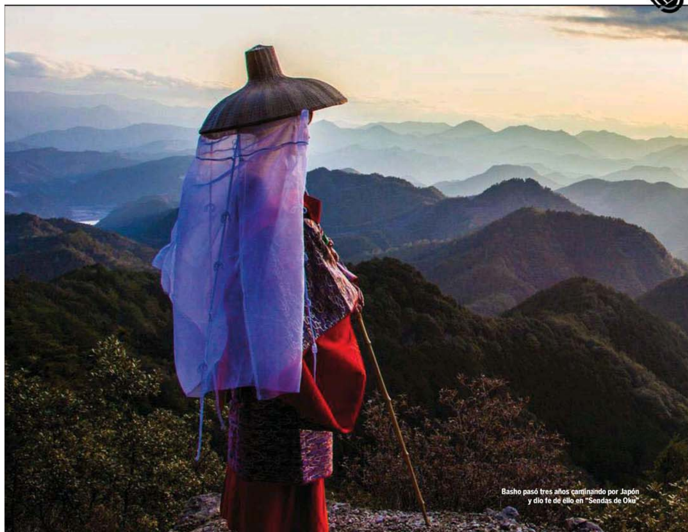
Basho pasó tres años caminando por Japón y dio fe de ello en " Sendas de Oku "

El viaje duraría cerca de tres años y los primeros meses de ese periplo se recogen en sus diarios, publicados con el título de Sendas de Oku .