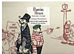
Barón Bean Tiras completas 1916

El volumen que ahora presenta en español Reino de Cordelia recopila el primer año de vida de este curioso aris-