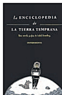
La enciclopedia de la Tierra Temprana

Más que la enciclopedia a la que alude su título, esta novela gráfica es una epopeya. El relato épico, que bebe de cuantas fuentes puedan imaginar, sobre cómo un joven venido del Norte se cruzó en los mares antárticos con un joven del Polo Sur y sobre cómo esos dos seres llamados a fundirse en uno solo se encontraron separados por una misteriosa alteración electromagnética. Tal vez la explicación de un fenómeno tan poco habitual, que dos polos llamados a atraerse se repelan pese a todos sus intentos por unirse, se encuentre en los orígenes de él. Porque hubo un tiempo en el que el joven fue un niño que se disputaron tres hermanas. Y la intervención de un "hombre medicina" pareció resolver el enfrentamiento. Sin embargo, el arreglo fue en falso. Un error difi-