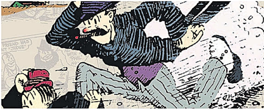
Barón Bean, en una de las innumerables fugas que pueblan sus tiras cómicas. | GEORGE HERRIMAN / REINO DE CORDELIA