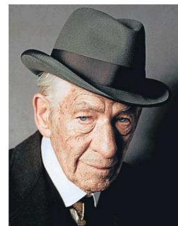
Ian McKellen es el anciano Sherlock Holmes en el filme 'Mr. Holmes', basado en esta novela, que se estrenará en otoño

Sussex, dedicado a la apicultura, Holmes bromea con la vanidosa soberbia de su juventud. Su reflexión recuerda una frase de Ryszard Kapuscinski: "Contemplo mi vida pasada como una isla que se va". Así, ese Holmes que ha visto dos guerras, que ha viajado a Japón y no ha olvidado algunas obsesiones, se permite ejercer una vez más.