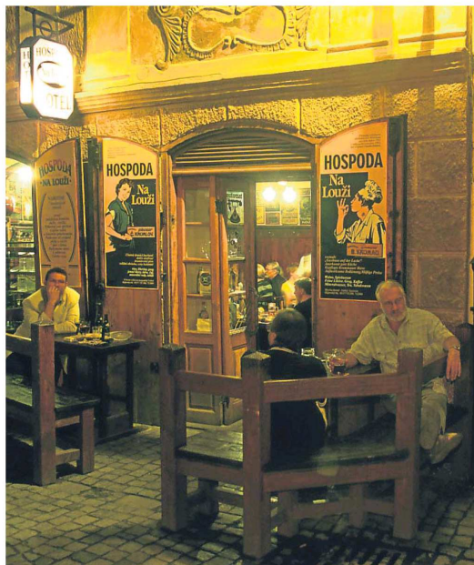
Hrabal acudía a contar sus historias en una taberna como la de la foto