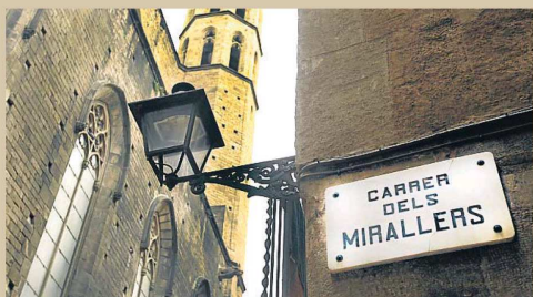
En la calle Mirallers (Barcelona) se halla la Casa de Oraciones

Precisamente por la velocidad, la osadía formal, los cambios de punto de vista y la "lengua pre-xava", que dice Enric Casasses, la apuesta de Verdaguer Edicions, de brindarnos el texto a través de la mirada de un poeta contemporáneo, es muy bienvenida. Casasses es un buen conocedor de la obra y del contexto y se ha interesado por esta Barcelona de finales del XIX de gran efervescencia espiritista. Casasses habla de Verdaguer desde la admiración y eso nos lo acerca aún más a nuestros días. El poeta tiene algo que sólo es suyo y de dios y que no la cederá nunca, y esto es el alma. Lejos de acusar a Verdaguer de una exageración del ego, Casasses nos explica que el poeta no es oveja del rebaño, es un individuo. Su terreno de actuación más idóneo es la iglesia, el gobierno y los ricos, aunque tampoco se les esca-