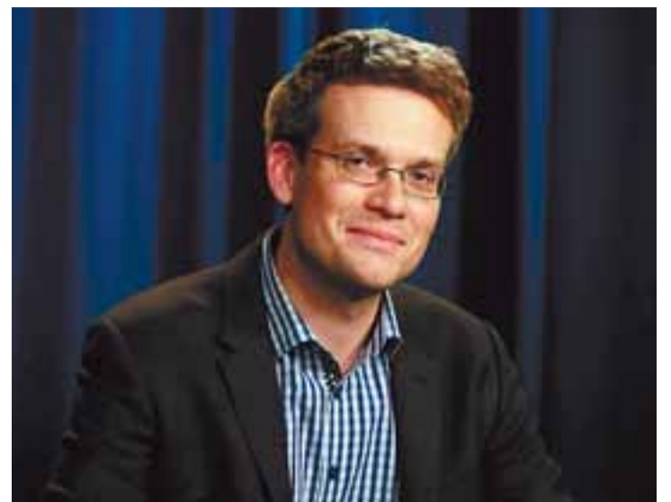
John Green, autor de Bajo la misma estrella .

La novela de John Green 'Bajo la misma estrella' fue el libro más vendido el año pasado