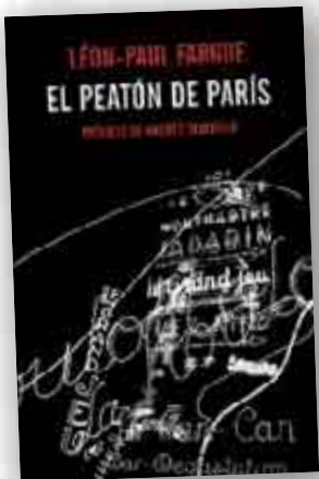
‘El peatón de París’

Autor: William Grill Traducción: Pilar Adón Editorial: Impedimenta Madrid, 2014 Páginas: 76