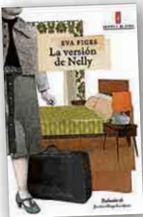
‘La versión de Nelly’