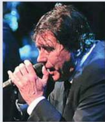
El cantante de Roxy Music

Viene Nick Cave cargado de decálogos, mandamientos, invocaciones, ángeles nocturnos, temores, mitologías, contradicciones, infancia inventadas/recreadas/recobradas. «¿Quién quiere conocer a los ídolos de su infancia?», se pregunta. Respuesta: él, cuando acudió a visitar a Brian Ferry. Y el vocalista de Roxy Music le reconoce que no ha escrito una maldita canción en tres años. «No hay nada sobre lo que escribir», confiesa antes de zambullirse en una piscina. La reacción de Cave resulta impulsiva, descontrolada, emotiva: «Esa noche me senté a escribir, frenético, página tras página, canción tras canción. ¡No podía parar! ¡A la vez, lloraba! Entre sollozos, las