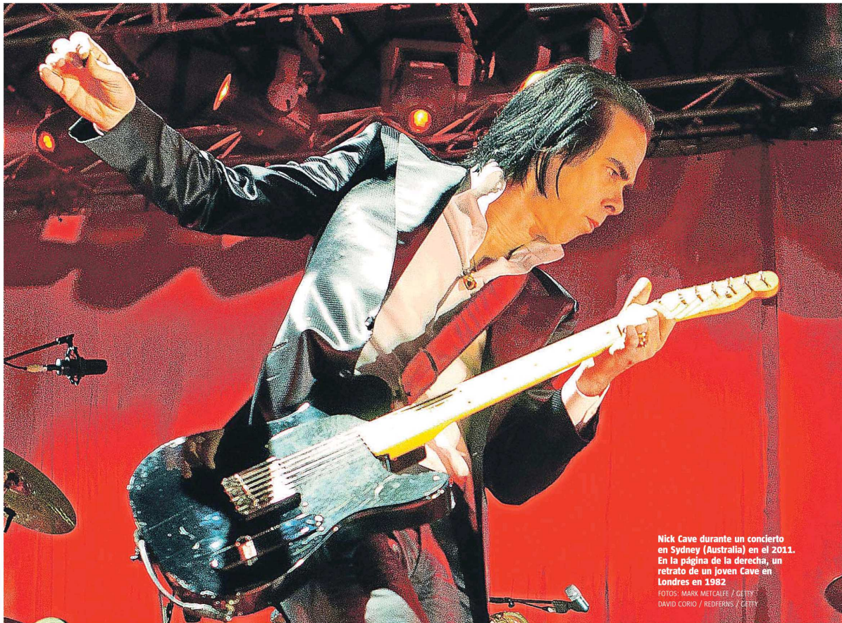
Nick Cave durante un concierto en Sydney (Australia) en el 2011. En la página de la derecha, un retrato de un joven Cave en Londres en 1982