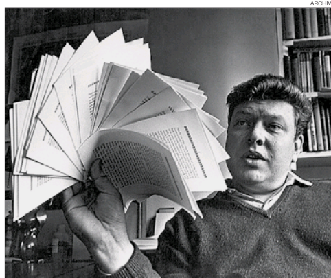
► Una imagen icónica del escritor británico B. S. Johnson.

Los desafortunados , la novela que viene en una caja (así por fortuna