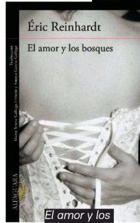
El amor y los bosques (Alfaguara).

emociones estéticas. Escribir sobre asuntos para defender una causa no es lo que me atrae. Pero sabía que si mi libro era bello, serviría a la causa de las mujeres y permitiría denunciar esta violencia.