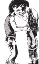
ILUSTRACIÓN PUNK Pionera del cómic autobiográfico en los años 80, Julie Doucet aborda temas tabú. La editorial Fulgencio Pimentel recopila su obra en Cómic (1986-1993).

CRIMINAL DE CULTO La educación de un ladrón (Sajalín) es el título de las memorias de Edward Bunker, que fue el preso más joven de San Quintín y actuó en Reservoir Dogs .