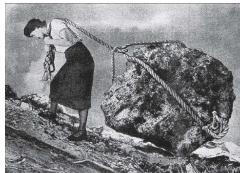
Los sueños de cansancio (1949), de Grete Stern.

Aires, que se clausuró la pasada semana y que, en realidad, se trataba de dos muestras monográficas paralelas de los dos artistas que se conocieron en 1932, en Berlín. De allí se marcharon a Londres y luego se establecieron en la capital argentina, donde compar-