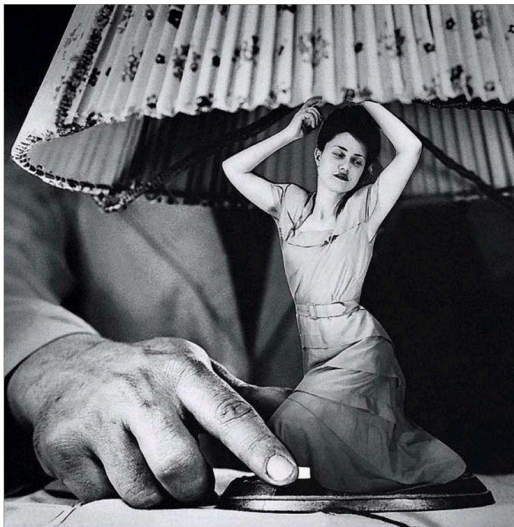
Artículos eléctricos para el hogar, fotomontaje de Grete Stern sobre gelatina de plata.

A pesar de ser publicados semanalmente durante casi tres años, "los fotomontajes fueron completamente ignorados en su época. Por un lado, la mala reputación de revistas como Idilio contribuyó a ello. Por otro, la crítica fotográfica en los medios masivos no existía, y el fotomontaje carecía de prestigio artístico como para que los críticos de artes plásticas se ocuparan de los Sueños ", señala en un texto recogido en el catálogo de Luis Priamo, estudio de la fotografía.