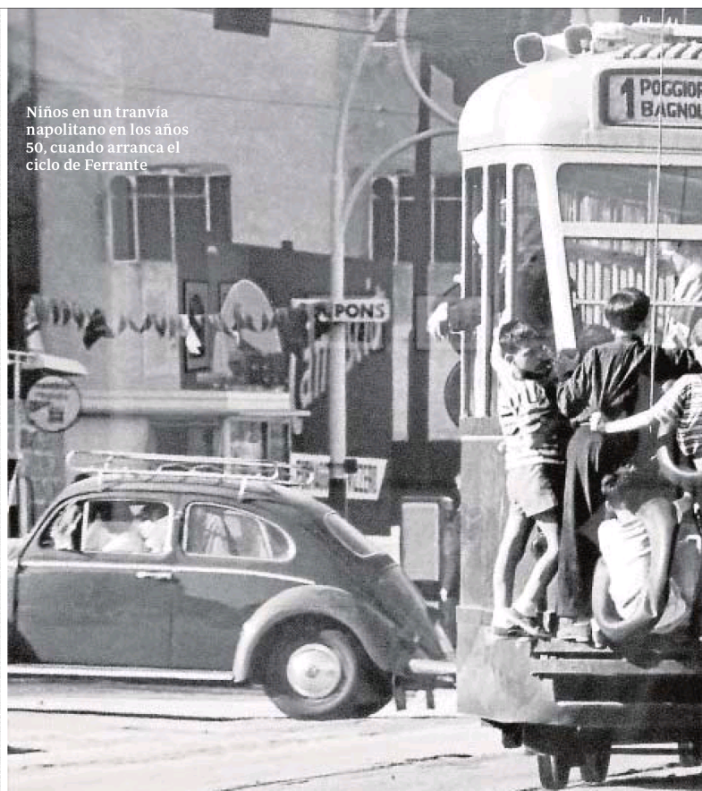
Niños en un tranvía napolitano en los años 50, cuando arranca el ciclo de Ferrante

Narrativa Trad. de Carlos Gardini Malpaso, 2015 240 páginas 20 euros