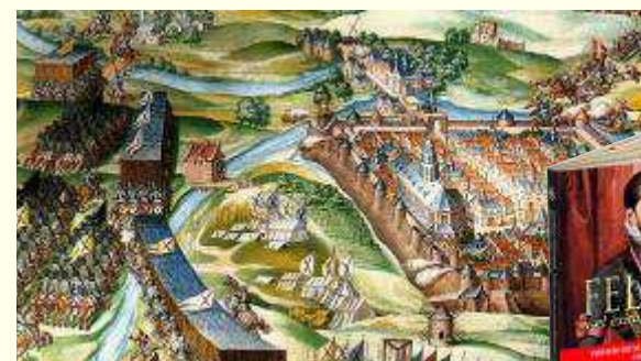
Detalle del fresco LA BATALLA DE SAN QUINTÍN, en el monasterio de El Escorial.