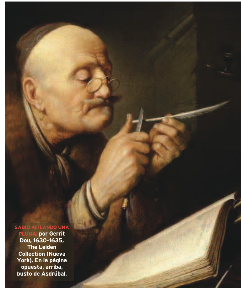
SABIO AFILANDO UNA PLUMA , por Gerrit Dou, 1630-1635, The Leiden Collection (Nueva York). En la página opuesta, arriba, busto de Asdrúbal.