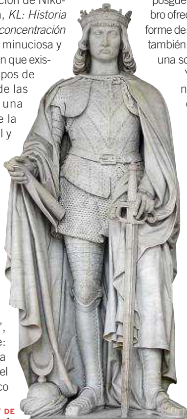
Estatua del REY DE ARAGÓN en el Palacio Real de Madrid.