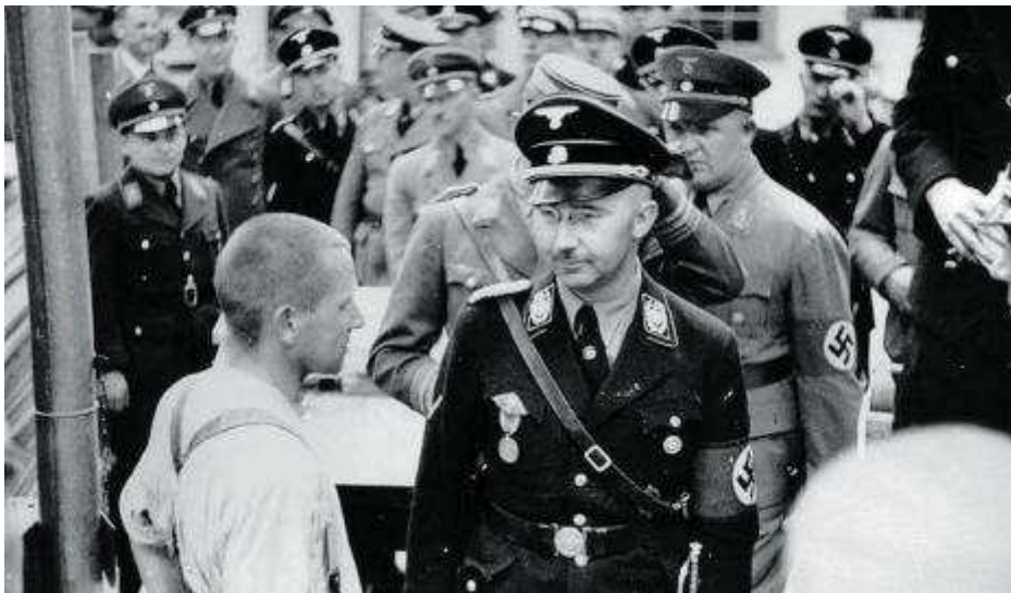
El jefe de las SS, HEINRICH HIMMLER , visita el campo de concentración de Dachau en mayo de 1936.