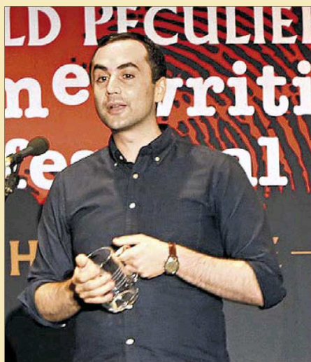
► El escritor Ray Celestin.

El nombre de Joaquim Carbó va asociado inmediatamente a su clásico infantil La casa sota la sorra . Pero Carbó lleva a cuentas unos 130 títulos, incluyendo las novelas juveniles policíacas protagonizadas por el detective Felip Marlot. Su primer libro para adultos, Els orangutans , tiene una fecha tan lejana como 1967. Ahora, a sus 83 años, recupera esa faceta, y se incorpora a una editorial de perfil tan joven como Males Herbes, para escribir de manera cruda sobre la crisis, a partir de la figura de un empleado de banca que acepta cualquier encargo que le pueda caer entre las manos.