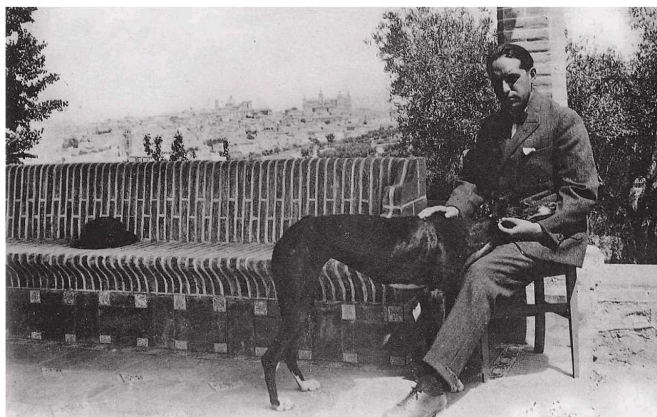
GREGORIO MARAÑÓN BERTRÁN DE LIS. MEMORIAS DEL CIGARRAL. TAURUS. 28,90 EUROS El cigarral toledano del doctor Marañón fue un escenario clave en el advenimiento de la Segunda República y un reflejo del gran nivel de la cultura y la ciencia españolas de entonces. Marañón hijo evoca aquel caserón donde banqueteaban, conversaron y pasearon desde los presidentes de Francia Édouard Herriot y Charles de Gaulle, Madame Curie o Fleming hasta Zuloaga, el torero Belmonte, Lorca, Unamuno, Ortega, Gutiérrez Solana o Manuel de Falla. El libro incluye abundantes fotos y combina eficazmente álbum familiar y memoria histórica