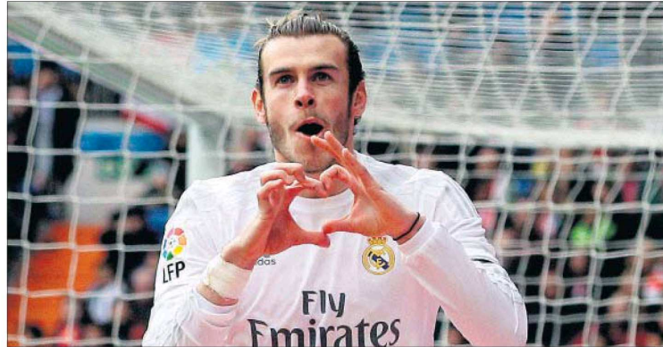
Bale celebra su gol al Sporting en el Bernabéu el pasado día 17.