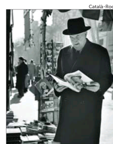
Josep Maria de Sagarra leyendo periódicos en las Ramblas