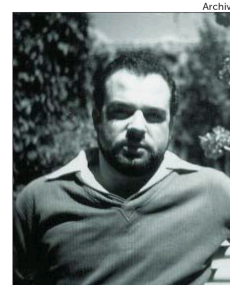
El célebre sotano de Jaime Gil de Biedma aparece en esta obra

El volumen se cierra con una suerte de quién es quién en esta Barcelona de las letras, la misma que ha hecho posible que coincidan Salvat-Papasseit, Machado, Rodoreda, Orwell, Cervantes y Marsé. Casi nada.