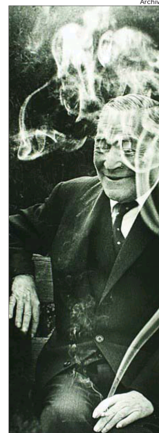
La Barcelona de Josep Pla surge en las páginas de «El quadern gris»