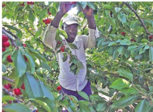
Un temporero recoge cerezas en Corbins (Lleida).

La piel de la frontera se organiza mediante relatos. Historias que el narra-