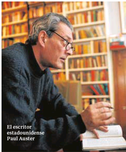
El escritor estadounidense Paul Auster