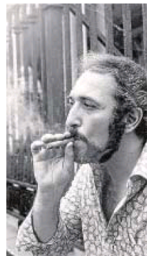
El neoyorquino, y judío, Bruce Jay Friedman

teatro y de cine, best-seller a la hora del cínico manual de auto-ayuda y de orientación sexo-sentimental para «maduros tipos solitarios», cameo en películas de Woody Allen (quien lo idolatra), narrador eximio de lo judío ( Besos de madre , alguna vez en Lumen junto a los perfectos cuentos reunidos en Los ángeles negros ), responsable de una antología canónica sobre humor