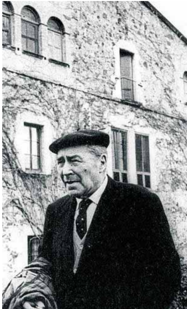
Josep Pla ya en su madurez.