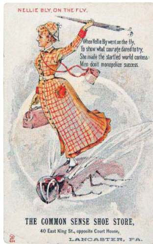
Un cartel que elogia el trabajo de la periodista.