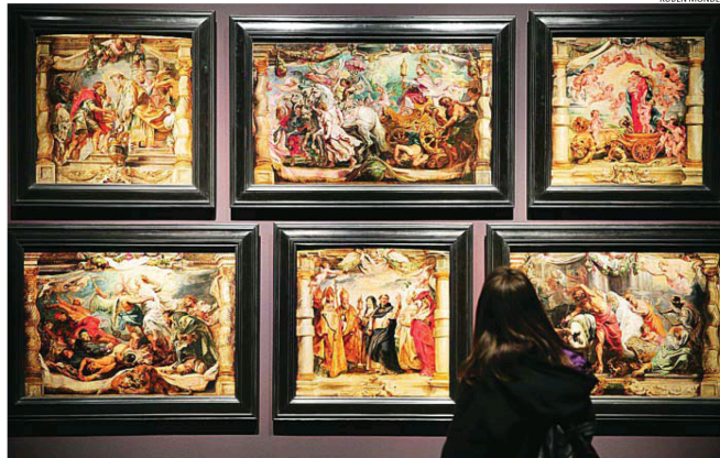
Los bocetos de Rubens cubren una de las paredes de la exposición

El Prado dedica la muestra más completa que se ha hecho sobre estas piezas del artista, quien les dio su identidad como obra autónoma