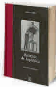
▶▶ HACIENDO DE REPÚBLICA ▶▶ Julio Camba ▶▶ Catalina Luca de Tena. 327 PÁGS. 19,50 €

Aunque cubren un período que va más allá del propiamente republicano, pues incluyen también las anotaciones correspondientes a la Monarquía alfosina y los años de la Guerra Civil, los diarios de Manuel Azaña (1880-1940), presidente de la II República entre mayo de 1936 y marzo de 1939, son un documento de un innegable valor histórico y, sobre todo, una fuente de primer nivel para conocer el día a día de la República a través de uno de sus principales protagonistas. Por sus páginas asoma la historia de esos años turbulentos contada desde el punto de vista «oficial» (el que se desprenden de sus discursos políticos, mucho más conocidos), sino desde la óptica personal e íntima de unos papeles cuya recopilación y publicación no resultó nada fácil. Una muy buena edición, que cuenta, además, con un amplio estudio introductorio del gran especialista en Azaña que es Santos Juliá.