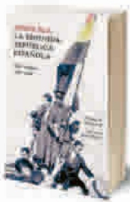
▶▶ LA SEGUNDA REPÚBLICA ESPAÑOLA. Josep Pla ▶▶ Destino. 1.844 PÁGS. 46 €