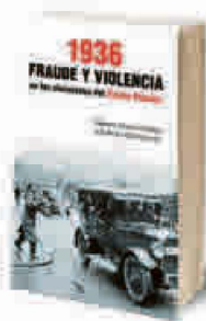
▶▶ 1936. FRAUDE Y VIOLENCIA... ▶▶ Álvarez Tardío y Villa García ▶▶ Espasa Libros. 656 PÁGS. 24,90 €

Al maestro Josep Pla (1897-1981), considerado el mejor prosista de la literatura catalana contemporánea y uno de los mejores periodistas españoles del siglo xx, la proclamación de la República le pilló en Madrid, donde ejercía como corresponsal de La Veu de Catalunya . Aunque de sus dos libros sobre el tema el que más fama ha alcanzado es, quizá, el dietario Madrid, el advenimiento de la República , su obra magna sobre el régimen republicano fue esta monumental historia que publicó en cuatro gruesos volúmenes, entre 1940-1941. Una crónica excepcional que, sin embargo, no debió dejar satisfecho a su autor, que la silenció y no quiso reeditarla en vida. Por suerte, la misma editorial Destino, que ya publicó la primera edición y que no la incluyó en la Obra completa , la rescató en una magnífica edición en tapa dura, con un sugerente prólogo de Valentí Puig, y con traducción y edición del Xavier Pericay.