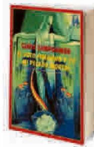
▶▶ EL VOTO FEMENINO Y YO: MI PECADO MORTAL. Clara Campoamor ▶▶ Renacimiento. 272 PÁGS. 17,90 €

Como muchos escritores e intelectuales de su generación, Manuel Chaves Nogales (1897-1944), cuya extraordinaria obra periodística ha sido puesta en valor durante los últimos años, hasta el punto de haberle convertido en el principal abanderado de lo que se ha dado en llamar la «tercera España», recibió la proclamación de la República con alegría y entusiasmo. Sin embargo, muy pronto se dio cuenta de que el fracaso del régimen podía venir no solo por la acción de sus enemigos externos e irreconciliables (monárquicos, falangistas, etc.), sino también por la de agentes internos y más radicales (comunistas, socialistas y anarquistas). Esta antología, preparada por la reconocida especialista en Chaves, María Isabel Cintas, es una muy buena selección de las crónicas y reportajes que el periodista sevillano publicó durante estos años en el diario republicano Ahora , del que él mismo era subdirector.