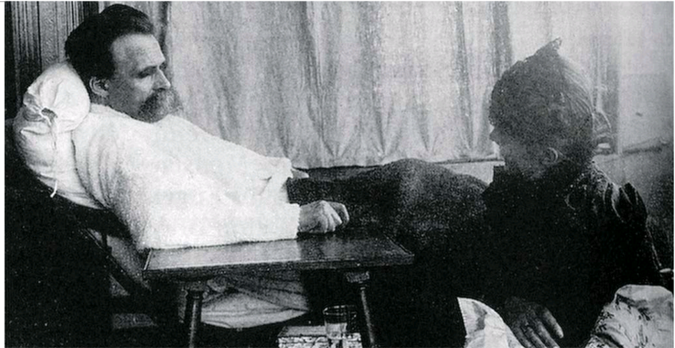
Friedrich Nietzsche, ya demente, en una imagen junto a su hermana tomada en Weimar en el verano de 1899

Ven la luz en español las misivas que su madre envió a un amigo de éste, Franz Overbeck, quien se preocupó por él en sus difíciles años finales, ya víctima de la demencia, frente a la interesada postura de su hermana, que quiso proyectar su pensamiento cercano al nacionalsocialismo