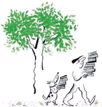
ILUSTRACIONES DE LAJALMOJA

Palabra de librero. Del arte al ensayo. De la poesía a los viajes. De la narrativa al cómic. Ochenta y cinco buenos libros para esta feria