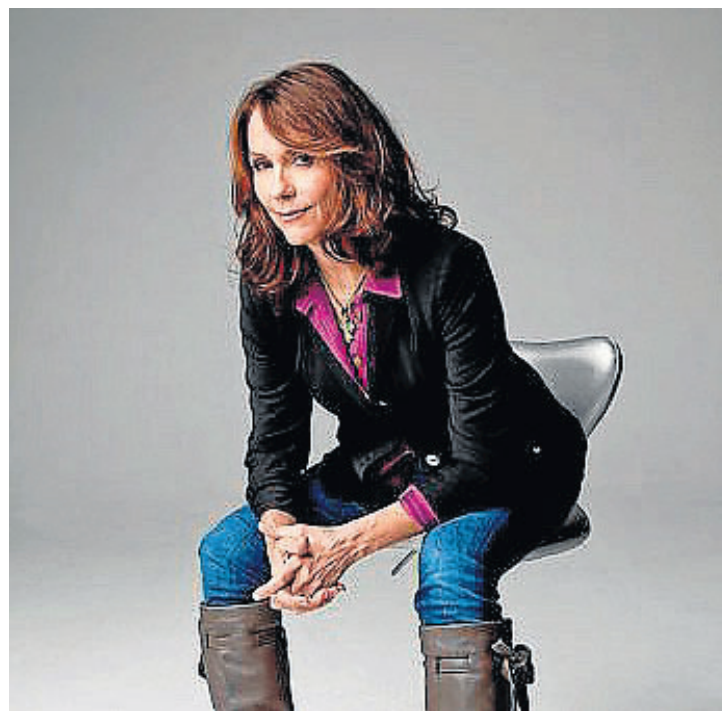
Mary Karr, durante su viaje por España. ERRATA/PERIFÉRICA

descubriremos primero las peculiaridades casi humorísticas del padre y la madre, para poco después ir abundando en los pasillos lóbregos de una infancia agrídulce en una ciudad industrial de Texas y después ir acercándonos al alma compleja de todos los com-