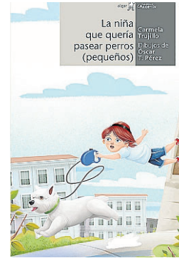
Portada del cuento.

2. ¿Quién es Ana? «Ana es una niña de seis años que no sabe leer ni escribir (bueno, un poquito) y que tiene unas ganas inmensas de poder hacerlo porque nadie de su familia le lee un cuento. Ana necesita de la palabra y saber manejarla tan bien como su amiga Penélope. Solo hay una cosa que supera ese deseo: tener un perro. Pero sus padres se niegan en redondo, claro, como la mayoría de padres, porque eso conlleva una gran responsabilidad. Sin embargo, Penélope tiene una idea extraordinaria: ¿por qué Ana no se hace paseadora de perros? Y ambas deciden ponerse manos a la obra».