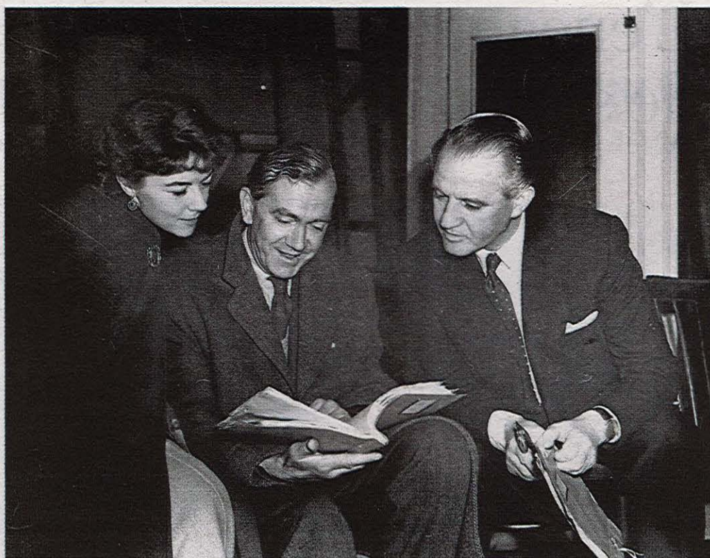
Graham Greene, al centre, amb dos actors de l'obra de teatre The living room .

EL SHOW DE ALBERT MONTEYS ALBERT MONTEYS CARAMBA 160 PÀG./17 €