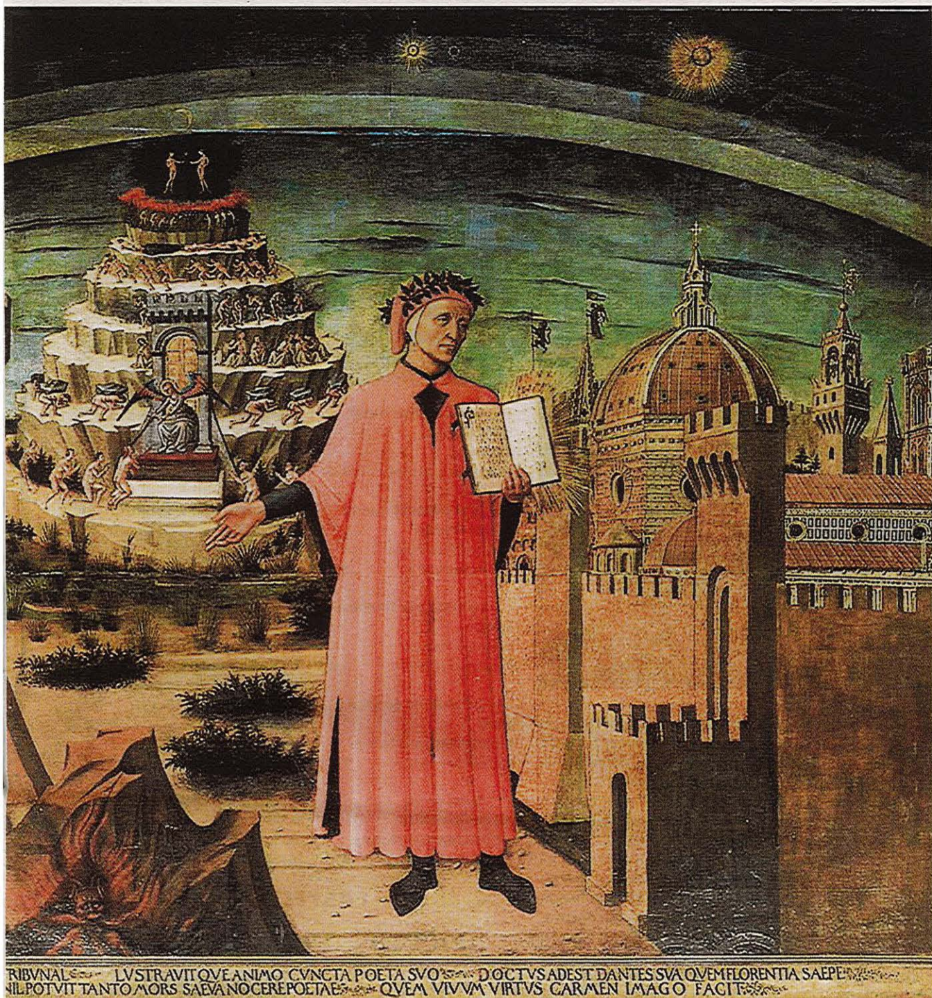
TRIBUNAL LVSTRAVIT QVE ANIMO CYNCTA POETA SVO DOCTVS ADEST DANTES SVA QVEM FLORENTIA SAEPE NIL POTVIT TANTO MORS SAEVA NOCERE POETAE QVEM VIVVM VIRTVS CARMEN IMAGO FACIT