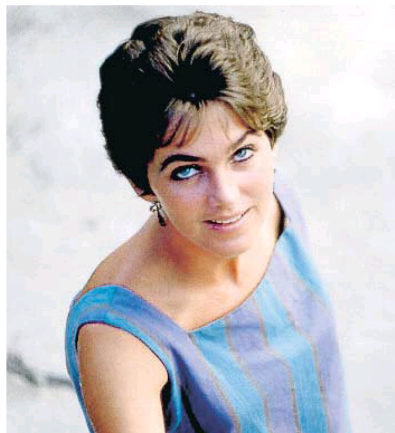
Vuelve Lucía Berlin. La autora cuyos cuentos han triunfado póstumamente