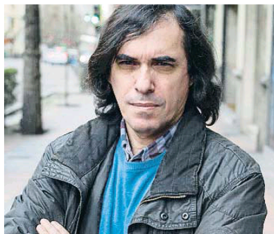
Un autor que ciega. Empieza a publicarse la obra magna de Cartarescu, Cegador