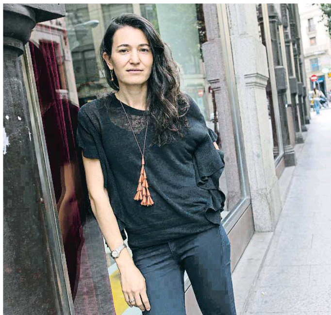
Psicoanálisis en el Hilton. Nicole Krauss envía a una escritora llamada Nicole al Hilton de Tel Aviv

La mayor catedral de Rumanía. El aláizguierda (Impedimenta/Peris-