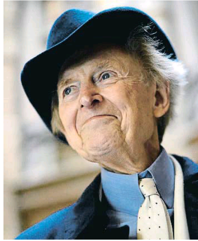
Wolfe contra Chomsky. ¿El combate lingüístico del siglo?

Una saga europea. La literatura alemana contemporánea es una de las menos traducidas en España, pese a su evidente riqueza. Este trimestre habrá ocasión de resarcirse con La octava vida (Alfaguara, 13 de septiembre), de la autora Nino Haratischwilli (Tiflis, 1983), una saga femenina monumental que recorre el este de Europa y el siglo XX a través de una familia, con fabricantes de chocolate, bailarinas y soldados. Fue declarada novela del año por Der Spiegel y el Frankfurter Allgemeine Sonntagszeitung . Más al norte, del danés Tom Kristensen (1893-1974) llega Devastación