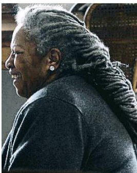
construcción de la otredad y las diferencias raciales