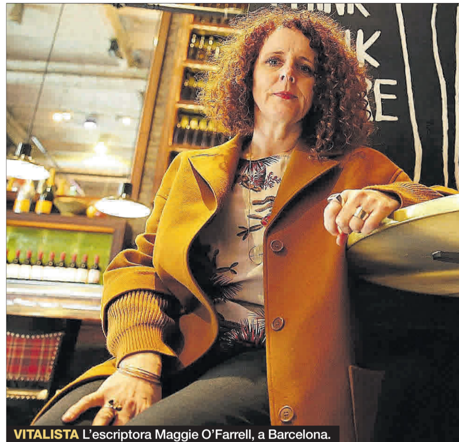
VITALISTA L'escriptora Maggie O'Farrell, a Barcelona.

A mesura que es desgranen els incidents, el lector, malgrat els sobresalts, sap que Maggie se salvarà, que seguirà endavant. La cosa es posa extrema en els dos últims capítols. Un en el qual relata com ella de petita va tenir una encefalitis que acabaria per alterar la seva percepció de l'espai, i l'últim, sobre el greu trastorn immunològic de la seva filla. «Havia d'anar amb molt de compte per no provocar que la gent se sentís malament o em compadís, perquè jo no em veig a mi mateixa com a algú que ha tingut mala sort o que ha sigut desgraciada. Més aviat el que volia és que els lectors pensessin en els seus pro-