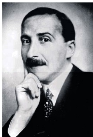
El gran escritor Stefan Zweig. ARC. ERRATA

Soviética en 1928 para asistir a la conmemoración del centenario del nacimiento de León Tolstói, donde pudo peregrinar a Yásnaia Poliana y contemplar su hermosa y discreta tumba. El intelectual austrohúngaro fue un fervoroso apólogo de la faceta ensayística