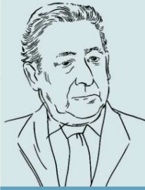
EL ARTÍCULO DE USSÍA