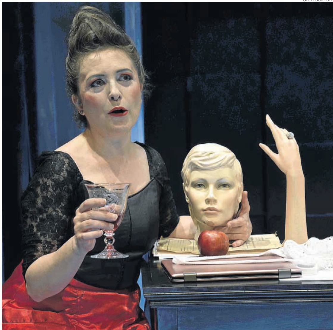
►► Una escena de 'Reglas, usos y costumbres en la sociedad moderna'.

Las bodas de plata se celebran después de 25 años de feliz unión. También se graban. Incluso en el caso de que la unión no haya sido feliz, si dura 25 años, hay que celebrarlo de todos modos. La novia avanza sin girar la vista hacia su alrededor. Camina derecha hacia lo que le espera. Sale de la iglesia del brazo del novio. Son, desde luego, 'Reglas, usos y costumbres en la sociedad moderna', un texto sobre los ritos de la sociedad occidental que escribió Jean-Luc Lagarce, que ya representó Anabel Alonso, y que ahora trae a la Sala Guirigai la actriz y directora Aitana Galán. Lagarce murió con 38 años, de sida; su obra no fue muy apreciada cuando vivía, pero ahora se le representa en todo el mundo. El mismísimo Xavier Dolan (qué buenos momentos nos ha dado este señor en el Festival de Cine Inédito de Mérida)