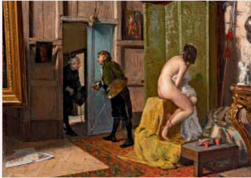
«La visita inoportuna», 1868, de Eduardo Zamacois