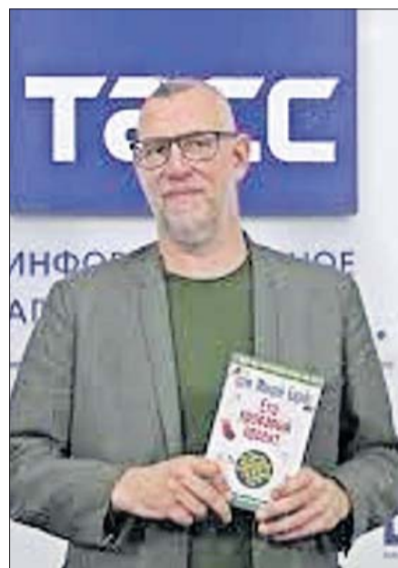
Graeme Macrae Burnet. LA OPINIÓN

De esta tradición ha bebido también el escocés Graeme Macrae Burnet (1967 para elaborar su segunda novela, 'Un plan sangriento. El caso de Roderick Macrae', ambientado en las Tierras Altas escocesas del siglo XIX. El autor plantea un crimen de ficción