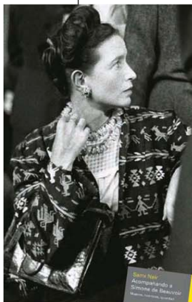
Acompañando a Simone de Beauvoir. Mujeres, hombres, igualdad. Sami Nair, Galaxia Gutenberg.

Pero el Castor fue mucho más, como nos cuenta Nair, una activista que se instala en EE.UU., vive en los barrios pobres y escribe un libro inmenso, América día a día , donde afirma que una igualdad formal no puede arreglar la cuestión negra: lo mismo sucede, dice, con las mujeres: la conquista de la igualdad es solo una parte, hay que cambiar la mentalidad masculina. En el capítulo más emotivo de esta biografía, Frente a la barbarie , se narra cómo ella y Sartre, a contracorriente de una sociedad hostil, denuncian el colonialismo, el racismo y la tortura y se declaran a favor de la independencia de Argelia. Que el porvenir tarda y lo intolerable está siempre presente fue la máxima de esta mujer única.