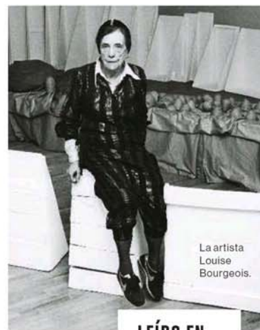
La artista Louise Bourgeois.